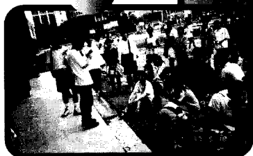
賽前集合講解規定