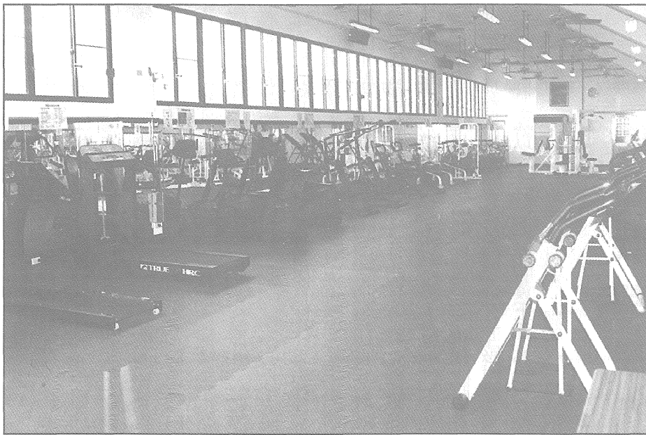
設備齊全的休閒健身房