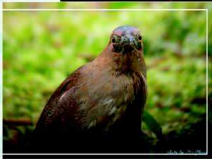
對看中的黑冠麻鷺