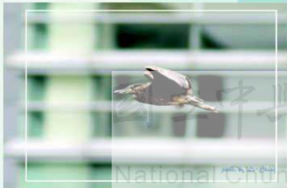
亞成的夜鷺習飛經圖書館前

校園內還有許多生態值得欣賞，其他鳥類與植物，種類不少，以前就已經有些有心的校友們做過不錯的報導，如藍天綠地工作室出版的「中興大學生態步道」就有十分詳細的自然生態解說，但是如果不親自走一回，也只是一般的紙上欣賞。本文只用平常的照片介紹中興湖畔易見的鳥類，其實在許多地方都可以看到，但是配合母校的校景絕對有不同的感覺，希望您能親臨現場感受這些生態之美，不論是親子共同觀賞或是獨自攝影練習，中興湖畔是絕對可以令您滿載而歸的。歡迎回母校逛逛！