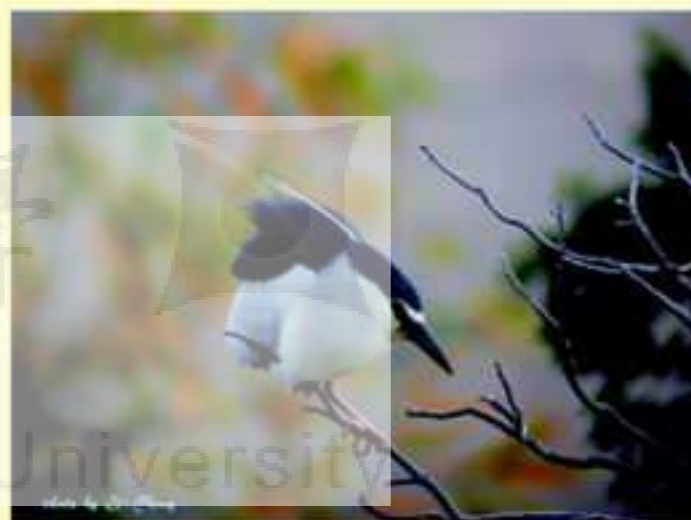
起風了，不下來就是不下來