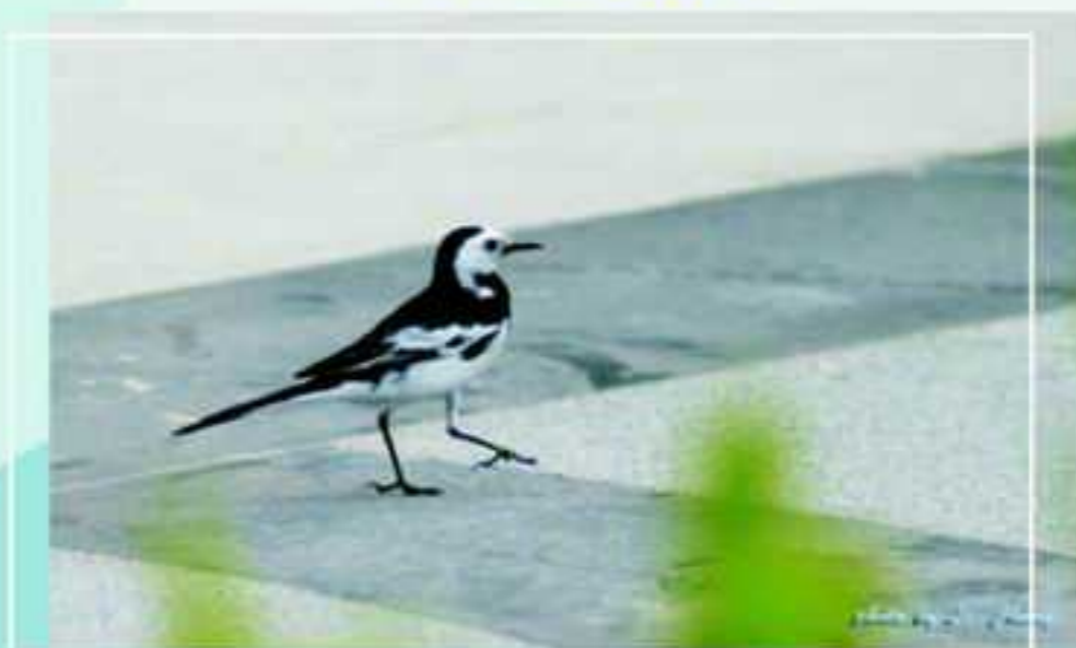
圖書館前的白鵝翎

校園內還有許多生態值得欣賞，其他鳥類與植物，種類不少，以前就已經有些有心的校友們做過不錯的報導，如藍天綠地工作室出版的「中興大學生態步道」就有十分詳細的自然生態解說，但是如果不親自走一回，也只是一般的紙上欣賞。本文只用平常的照片介紹中興湖畔易見的鳥類，其實在許多地方都可以看到，但是配合母校的校景絕對有不同的感覺，希望您能親臨現場感受這些生態之美，不論是親子共同觀賞或是獨自攝影練習，中興湖畔是絕對可以令您滿載而歸的。歡迎回母校逛逛！