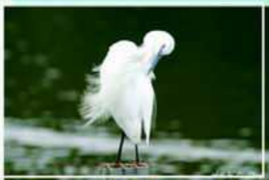
風起時，剪不斷理還亂...

其實，城市三俠麻雀、白頭翁和綠繡眼在中興湖畔也有不同的演出。枝頭上的麻雀也可顯露不同於地上的氣質；綠繡眼十分好動，個頭又小，不好用相機捕捉，但是吵雜的聲音與靈活的身影，可以讓小朋友感受其活力；白頭翁在不同時節，也有配合時事做即興演出。湖旁的試驗田區的草叢中，除了白頭翁成群出現外，斑紋鳥也是常客；夏日的鷓鴣，不論是草叢中的褐頭鷓鴣，或是清晨吃飽喝足在草桿上唱歌的灰頭鷓鴣，或是夕陽下尋找食物中翹尾的灰頭鷓鴣，都可以令人目不暇給；到了秋天，伯勞在這湖畔的草叢中捕捉食物的兇狠模樣或故做溫柔樣同樣值得慢慢的欣賞。