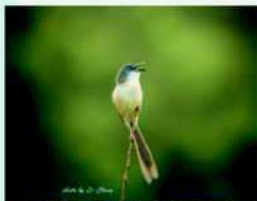
清晨吃飽的灰頭鷓鴣