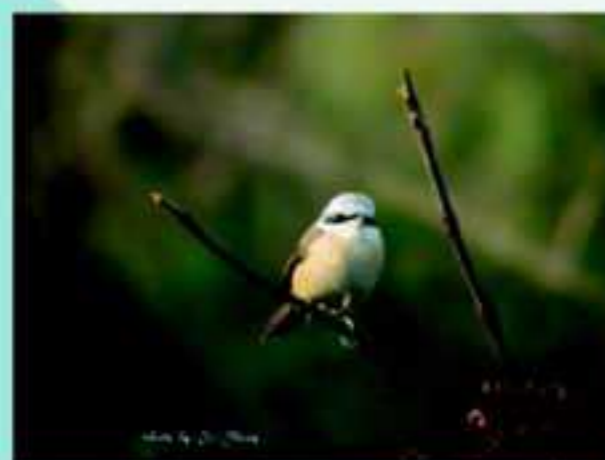
秋天的代表灰頭紅尾伯勞