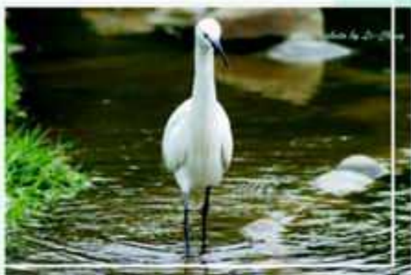
漫步中興湖的氣質就是不一樣

小白鷺也是中興湖畔的常客，姣好的身影優雅地走在湖邊令人驚艷，即使是天候不佳，如風大時，還是可以欣賞其整理羽毛的美姿。