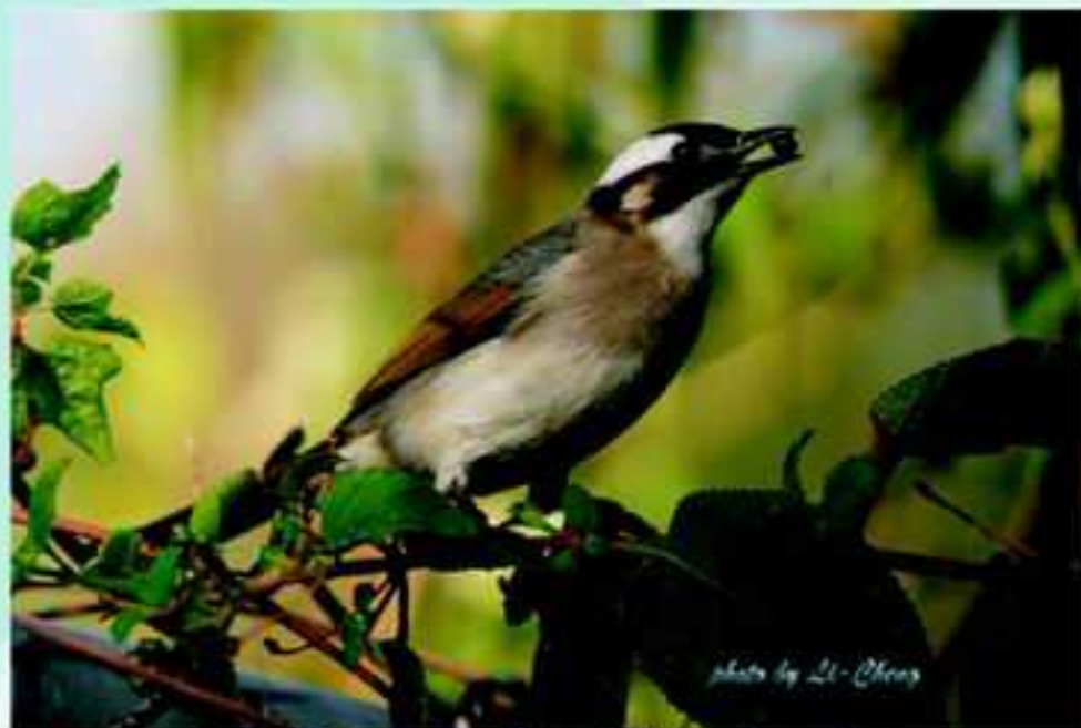
白頭翁愛吃湖畔的「春不老」種子