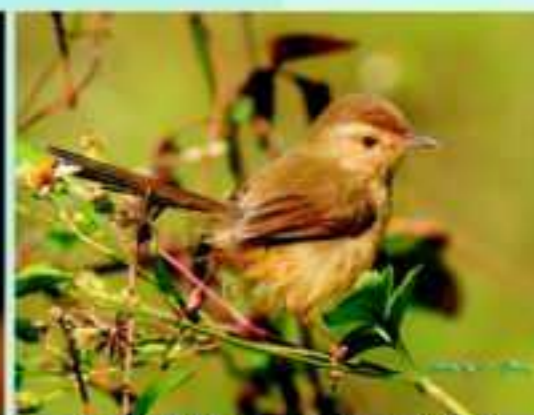
時機歹歹，大聲疾呼經濟好轉吧 草叢精靈之一 褐頭鷓鴣