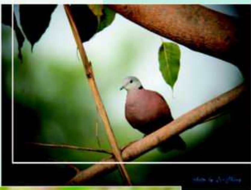
解三角習題中的紅鳩