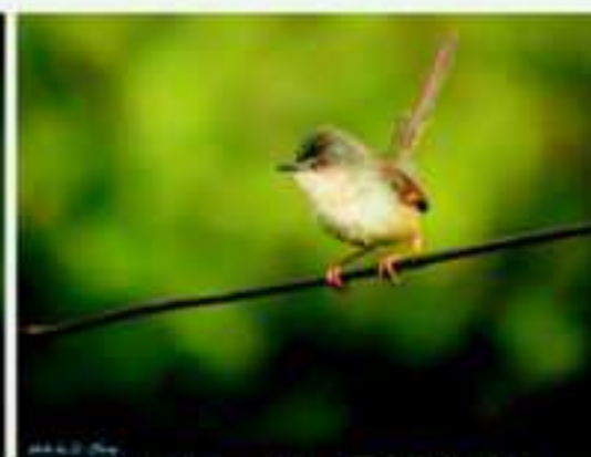
夕陽下的灰頭鷓鴣