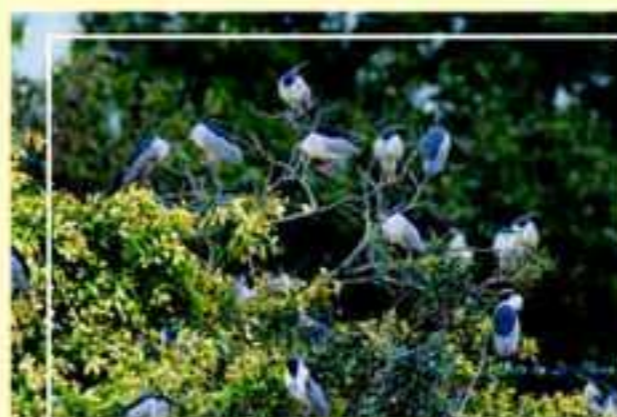
密度超高的居住環境，在台灣真的生活不易啊~~

在中興湖目前最多的鳥類除了麻雀以外，應該就是俗稱「暗光鳥」的夜鷺了。他們在無天敵的情況下，據鳥為王，用力繁殖到鳥滿為患。用肉眼或望遠鏡，看看矗立枝頭、飛翔美姿等，都可以令大人、小孩發出讚嘆之聲。天氣不好也別有一番感覺，例如枝頭上對抗強風，打死不退的模樣，令人感動。