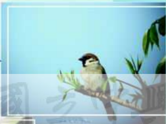
麻雀的藍天枝頭版

其實，城市三俠麻雀、白頭翁和綠繡眼在中興湖畔也有不同的演出。枝頭上的麻雀也可顯露不同於地上的氣質；綠繡眼十分好動，個頭又小，不好用相機捕捉，但是吵雜的聲音與靈活的身影，可以讓小朋友感受其活力；白頭翁在不同時節，也有配合時事做即興演出。湖旁的試驗田區的草叢中，除了白頭翁成群出現外，斑紋鳥也是常客；夏日的鷓鴣，不論是草叢中的褐頭鷓鴣，或是清晨吃飽喝足在草桿上唱歌的灰頭鷓鴣，或是夕陽下尋找食物中翹尾的灰頭鷓鴣，都可以令人目不暇給；到了秋天，伯勞在這湖畔的草叢中捕捉食物的兇狠模樣或故做溫柔樣同樣值得慢慢的欣賞。