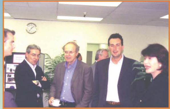
BMW科技主管參觀愛勝科技公司

在美國的空軍、陸軍、太空總署、歐洲的空中巴士他們邀請我演講，沒有一次能夠使我像今天這麼緊張、這麼興奮、心中充滿這麼多感恩，剛剛看到學弟學妹們精彩的熱門舞蹈表演，心裡真的好開心，因為我看到中興大學的活力，中興大學的朝氣。上回我來惠蓀堂是廿四年以前，同台上的學弟學妹們一樣，我也是來跳舞的，那年我大二，只是沒有像學弟學妹們這樣的膽識，我們不敢在台上跳，只敢在台下跳，或是人群裡面跳。轉眼廿四年過去了，想和學弟學妹分享的實在太多，其中影響我深遠的，正是剛剛台上學弟學妹們所展現出來的自信和膽識，如何擁有這份自信和膽識，當初我在景美女中第一個志願是森林系，那年我大姐從國外回來，好多年不見，知道我要填森林