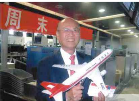
兩岸直航包機首航紀念

再一次的感謝母校給我傑出校友的榮譽，也覺得今後自己應該多做事來回饋母校，回饋社會。目前我兼職負責上海台商協會，敬請各位老師，學長，同學們如有機會來上海，請事先告知，讓我有機會在上海為大家服務，再一次地謝謝大家。