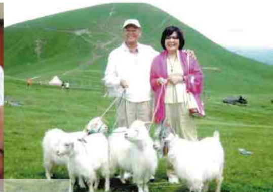
新疆大草原牧羊人