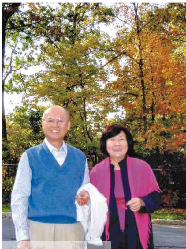
伉儷情深、相偕旅遊

教了第一章，第二章而已，因此，恰好可以利用擔任3年的小學老師時，利用晚上的時間到台南市補習班補習，雖然很辛苦，但最後總算很幸運的進入中興大學。