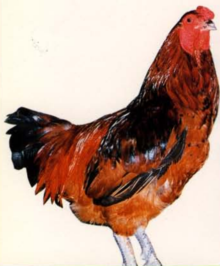
△ 苗栗的大型土雞(鬥雞)