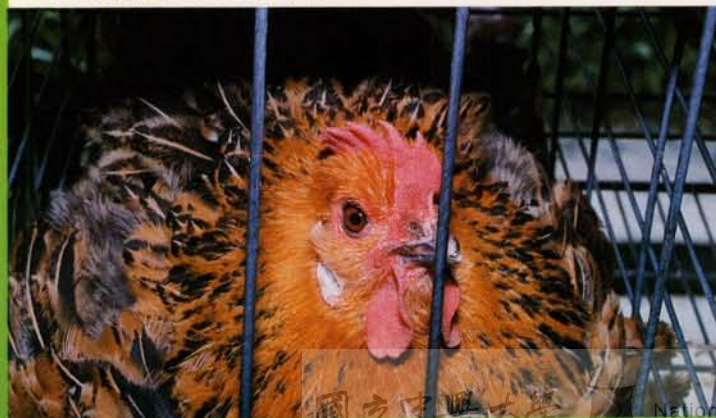
▽ 賴抱性是土雞的本性