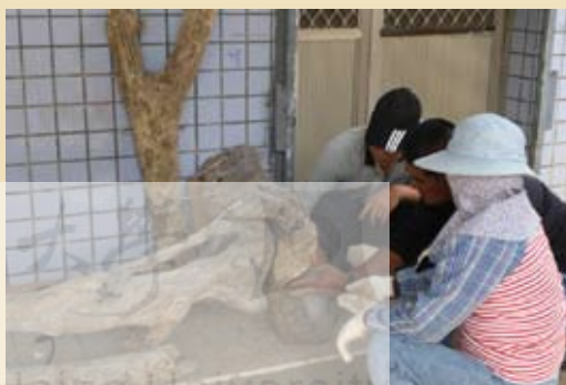
圖10.社頂部落解說員為遊客解說的情形