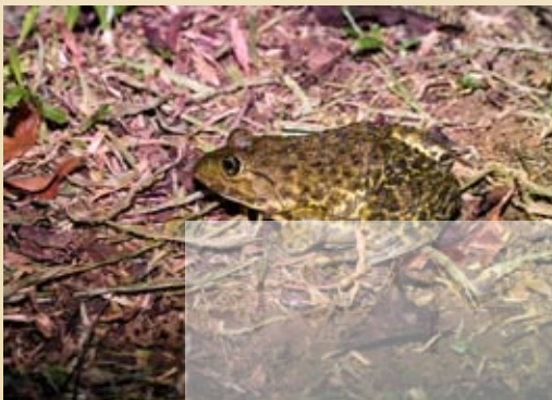
圖1.稻田裡常見的虎皮蛙