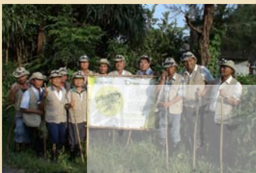
圖5.社頂部落居民組成的巡守隊