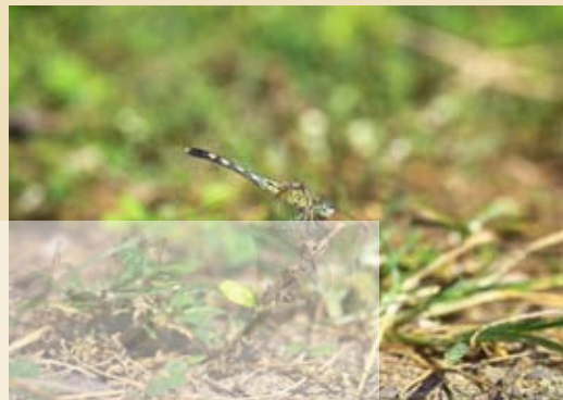
圖2.池塘邊常見的侏儒蜻蜓