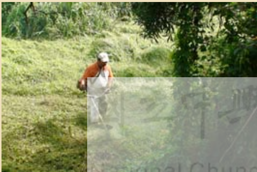
圖7.社頂部落進行環境的維護

第一階段計畫執行成效良好之社區，可申請晉級第二階段示範社區，本階段含第一年（為期一年）示範社區之先期整體規劃，補助經費以新台幣100萬元為上限，以及第二年至第四年（為期三年）示範社區之行動計畫，每年以新台幣150萬元為上限。本階段用意在於養成社區永續經營人才及引導居民參