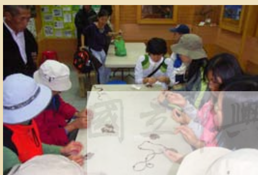
圖11.社頂部落進行居家環境景觀改善

社區執行資源調查是為瞭解與累積社區資源，以備未來發展生態旅遊、觀光產業或休閒農業之需。社區要走向永續經營，首要的條件是須徹底瞭解自身社區環境所擁有