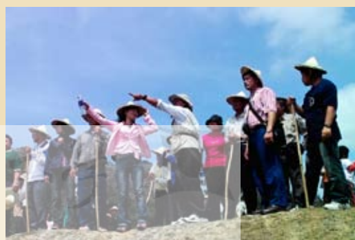
圖12.社頂部落解說員帶領遊客DIY製作銀合歡種子項鍊