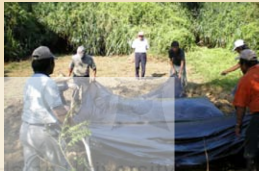
圖8.社頂部落居民營造水域空間以增加蛙類、蜻蜓、螢火蟲的棲息地