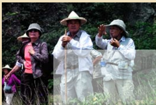
圖9.社頂部落解說員為遊客解說的情形

社頂部落，舊名「龜仔角」原本為排灣族原住民族部落，但已有相當程度的漢化。其位置座落於墾丁國家公園範圍內，與墾丁森林遊樂區、社頂自然公園、林業試驗所相比鄰。墾丁國家公園成立於1984年，為我國第一座國家公園，因此吸引了許多國內的遊客湧入，攤販、小吃、民宿等也如雨後春筍般