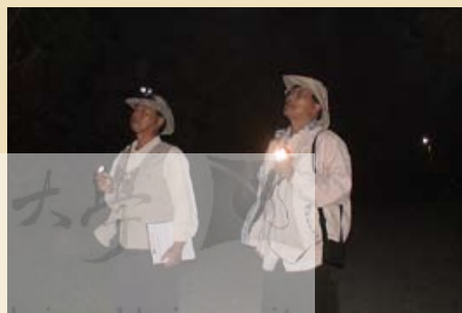
圖6.社頂部落居民夜間巡守的情形