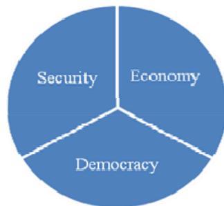
圖一：美國國家安全戰略三項核心目標

柯林頓政府在其 1995 年「接觸與擴大的國家安全戰略」開宗明義便說明此戰略足以肆應新的時代，從新的機會與威脅觀之，其中心目標即：一是以部隊應戰與有效率海外部署之能力，提升美國的安全；二是支撐美國的經濟復甦；三是促進海外的民主。 20