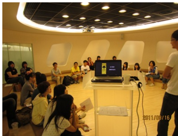
圖：發表練習室使用狀況

發表練習室開放當月時段供讀者預約,每月最後一天開放預約下個月時段。使用人每日可預約一個時段(3小時)，每月最多可預約2次。五人以上即可借閱使用，空間上限可容納至二十五人。