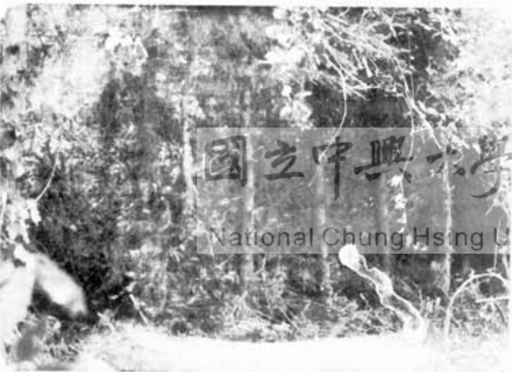
圖六： 第V樣區經疏開蔓藤雜草後之立木地形。分叉與不定根。 民國71年3月攝