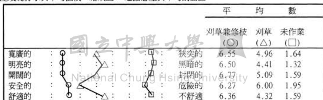
圖2. 訪者對刈草兼修枝、刈草及未作業三種處理之語意差異平均剖面圖

全體受訪者對刈草兼修枝、刈草及未作業三種處理之森林景觀比較感受的結果，就森林景觀美質正面評價最強烈，予以最高的7分，而後依序遞減至美質負面評價最強烈的1分。將各階之人數，換成分數，予以量化。得到受訪者對刈草兼修枝、刈草及未施業三種處理之語意差異感受總分求其平均值後，繪成圖2之語意差異平均剖面圖。