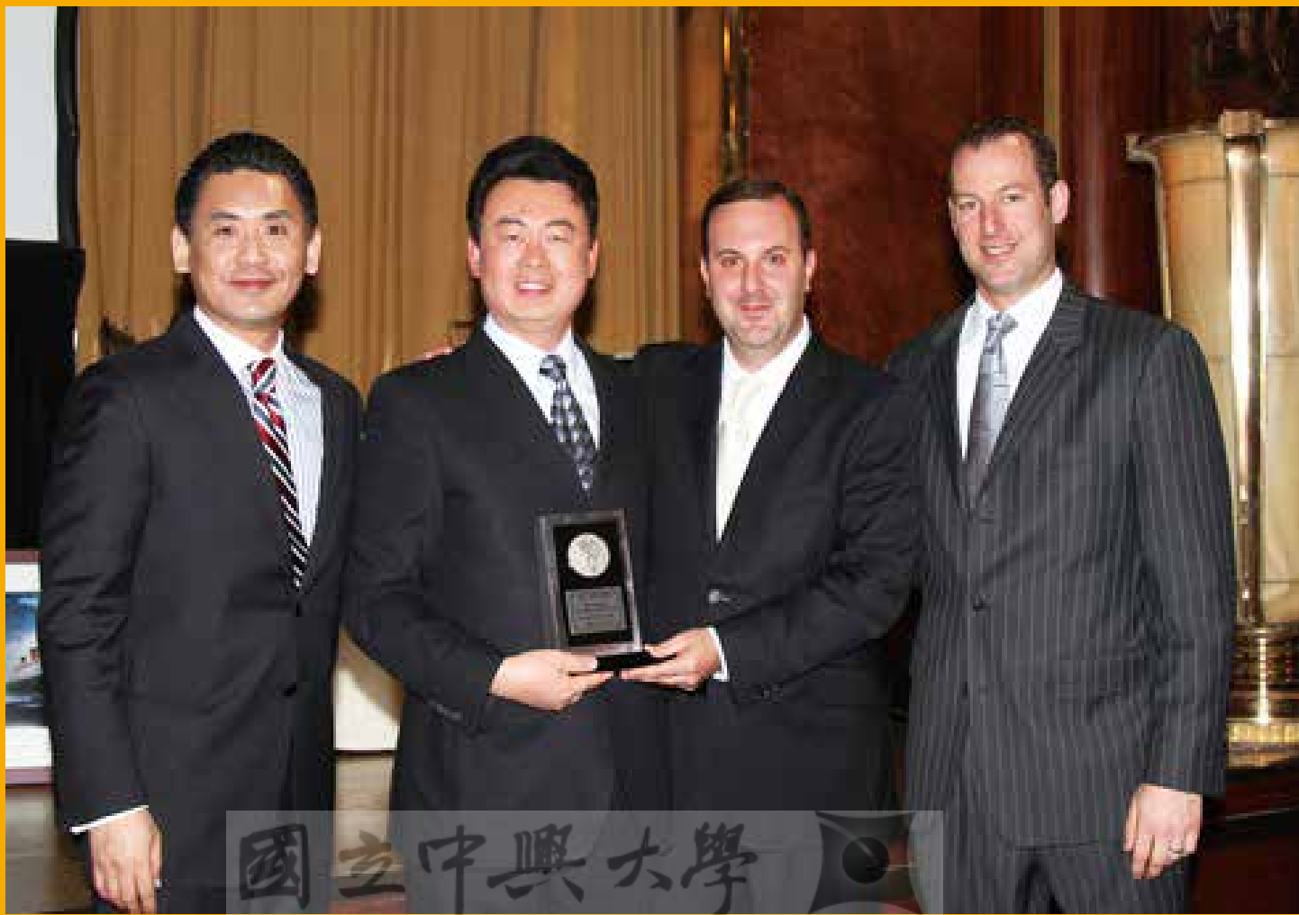
當選美國 AXA 年度最佳經理