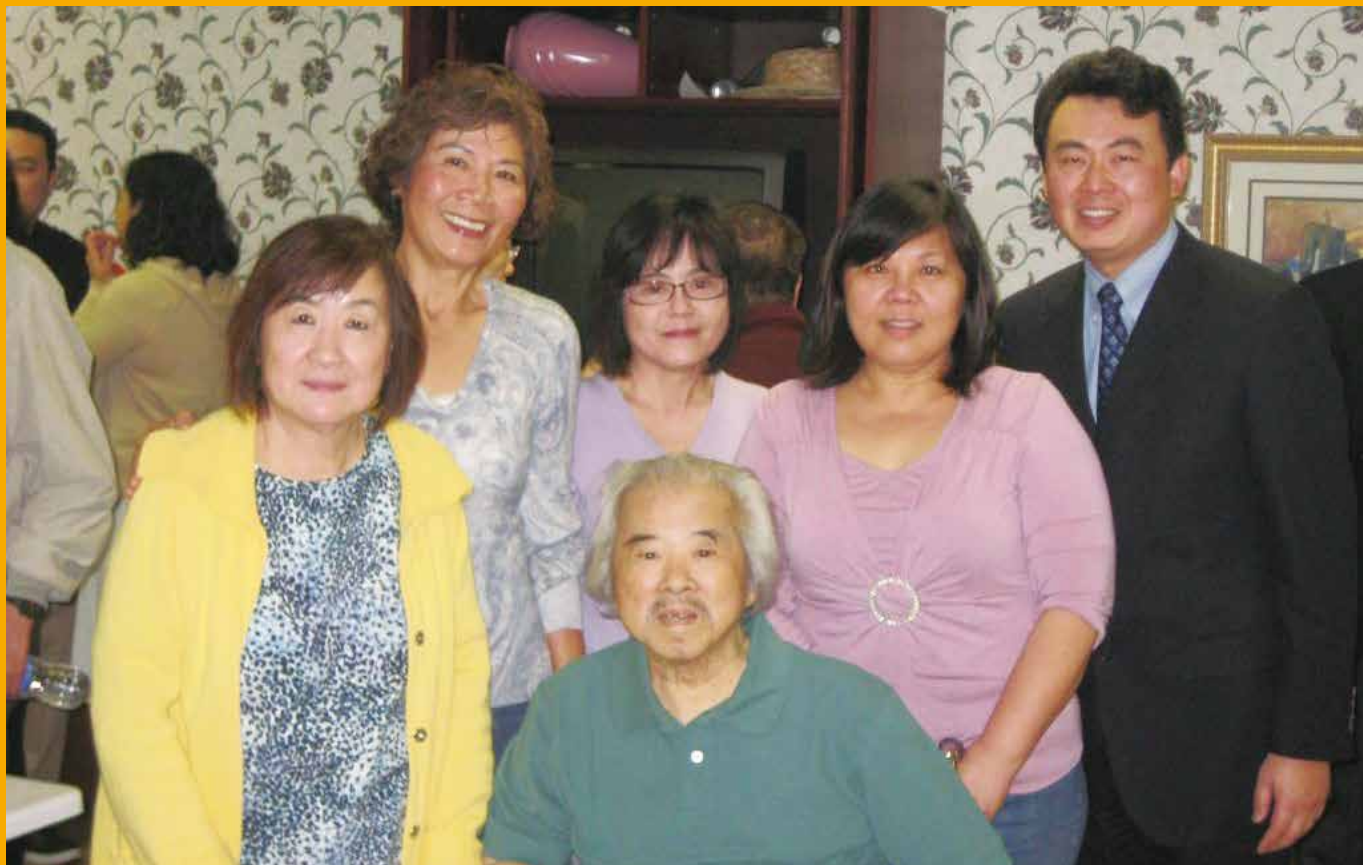
中興南加校友參加徐爾惠學長受浸禮