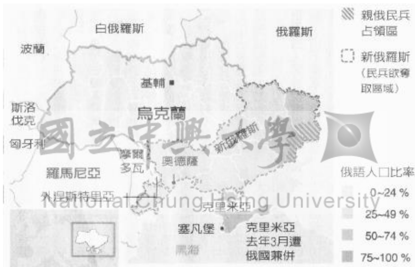
圖1：烏克蘭東部交戰地區和俄語人口比率

2月烏克蘭危機爆發時，被國會取消。由於2014年2月烏克蘭親俄總統亞努科維奇被親歐盟示威者驅逐下台，離開首都基輔之後，位於頓巴斯兩個州的分離主義者在未經烏克蘭政府同意的情况下，自行組織全民公投，分別成立「盧甘斯克人民共和國」與「頓涅茨克人民共和國」，並於2014年5月聯盟而成「新俄羅斯聯邦」（參見圖1）。