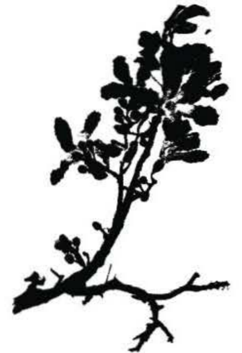
水墨花 by 洪佩蓉