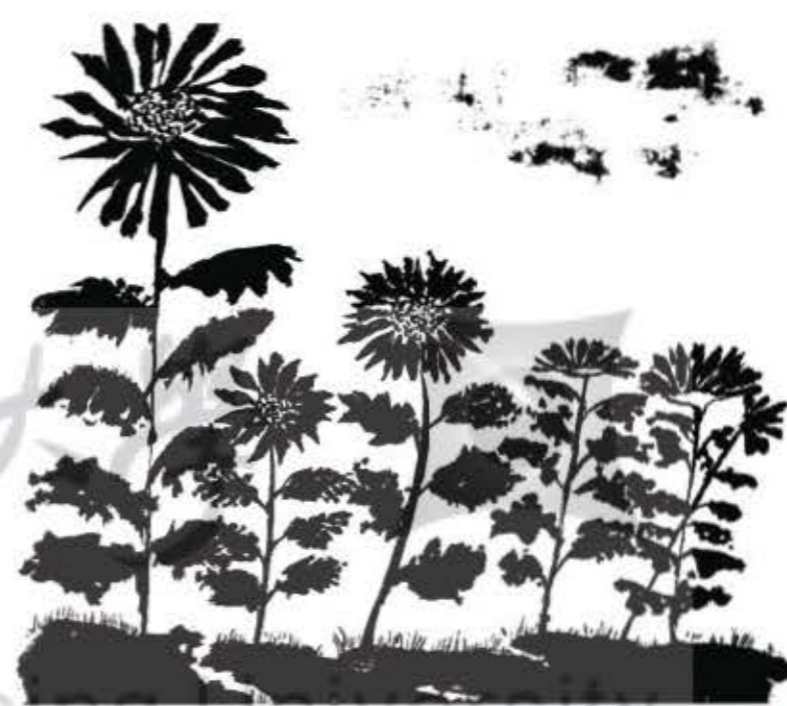
水墨花 by 曹伊芝