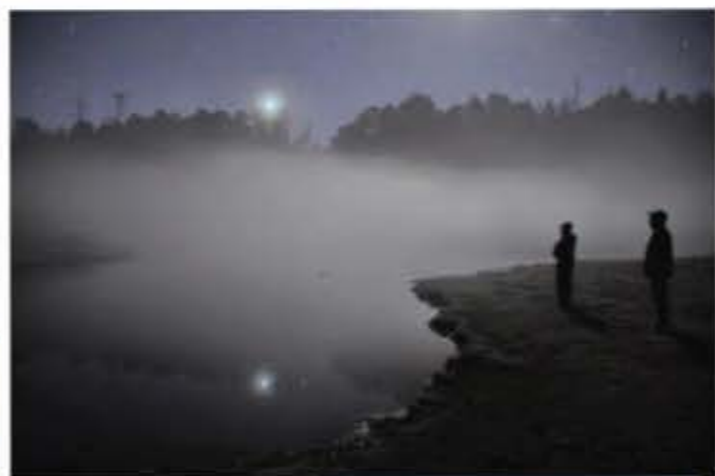
晚上的星星真的很亮 =]