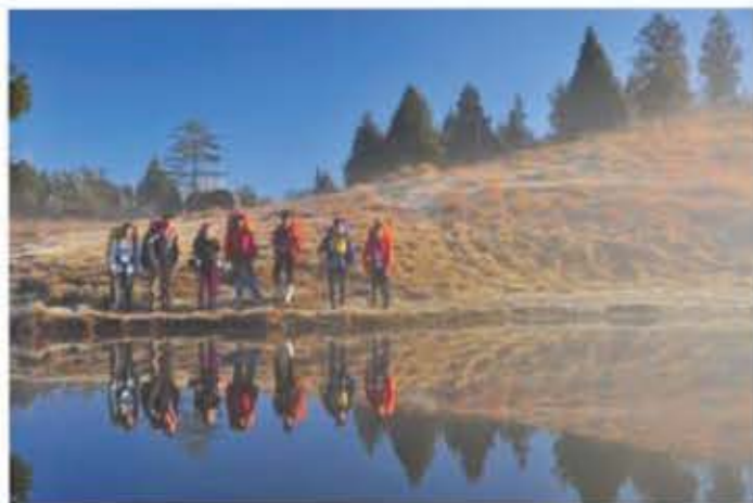
離開加羅湖前拍一張小合照 準備衝完最後的路線了!!

第一次開的隊，很多事情都要由自己來處理，行前計畫、公文、保險等等，當時印象中最擔心天氣，行前一直祈禱有個好天氣，然後這一路上可以平安，還好出發時的毛毛雨到了隔天是令人開心的好天氣！這次要去的地方是位於宜蘭的加羅湖，通常大家都會從太平山那邊走過來，這次我們要反方向從四季走到加羅湖，然後再走到太平山（就是逆走啦 XD）。這樣走最大的缺點就是，要爬一段陡上好幾百公尺的坡，用時間說明就是花一個小時在爬好漢坡，當然也有好處就是不用繳太平山的門票（YA~）。整個行程下來是一個算是悠閒恣意的路線，只是有些地方要抓好方向、鑽一下芒草、走過泥濘，其他幾乎沒甚麼問題，連我們晚餐一人都有一隻大雞腿可吃就知道是一隻很爽的隊了吧！加羅湖的美真的很難用言語表達，如果真的想知道，就自己親身去感受一下，你就可以知道我當時的感動了。=]