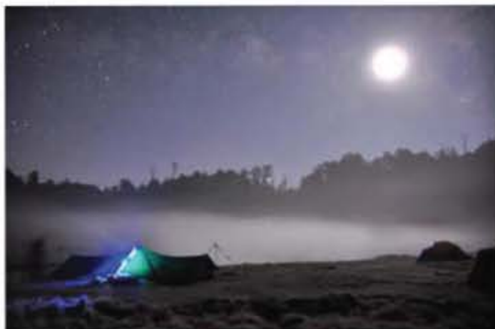
早晨月亮還未消失以前 山嵐環繞在湖邊 有種淡淡的朦朧美