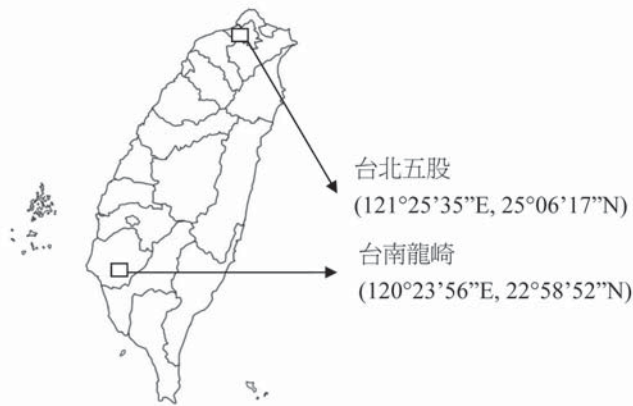
圖1 台北五股及台南龍崎地區綠竹林樣區位置略圖