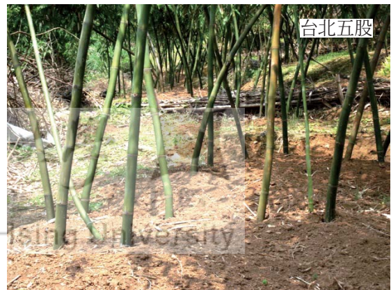
圖3 台南龍崎及台北五股之綠竹林樣區