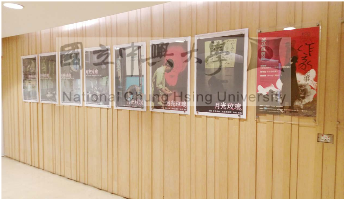
圖5 誠品藝術節《月光玫瑰》攝影作品展