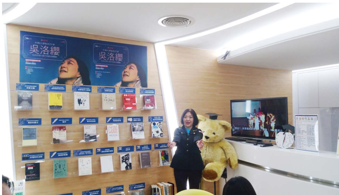
圖1 興閱坊展出劇本寫作推薦書及定時播放作品集

圖書館與人社中心合作辦理駐校作家活動，由2015駱以軍、2017陳雪至今年的吳洛纓，已有三年了，有謂辦理一年、二年是活動，辦理三年就形成一個文化了，希望與人社中心合作辦理的駐校作家活動，能形成一個年年持續的文化，為提升興大人文素養盡一份心力。