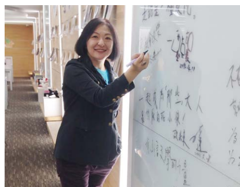
圖3 興閱坊作家留言板簽名：「寫，就會改變」