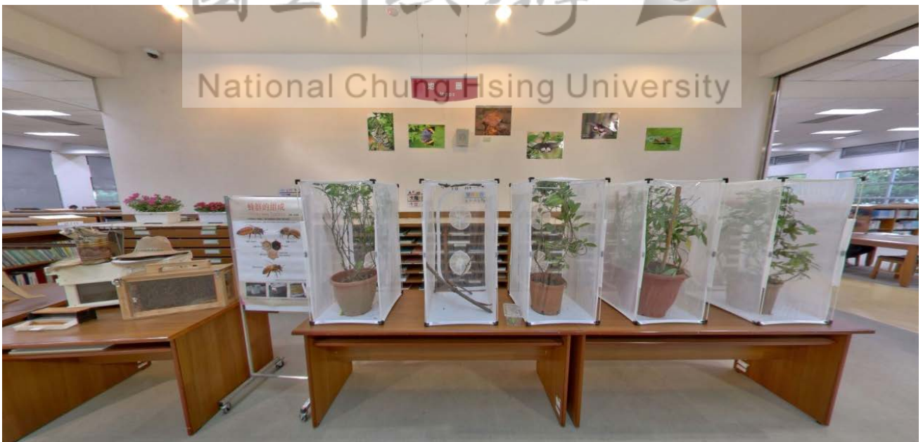
圖5 蝴蝶幼蟲與蜜蜂生態展示