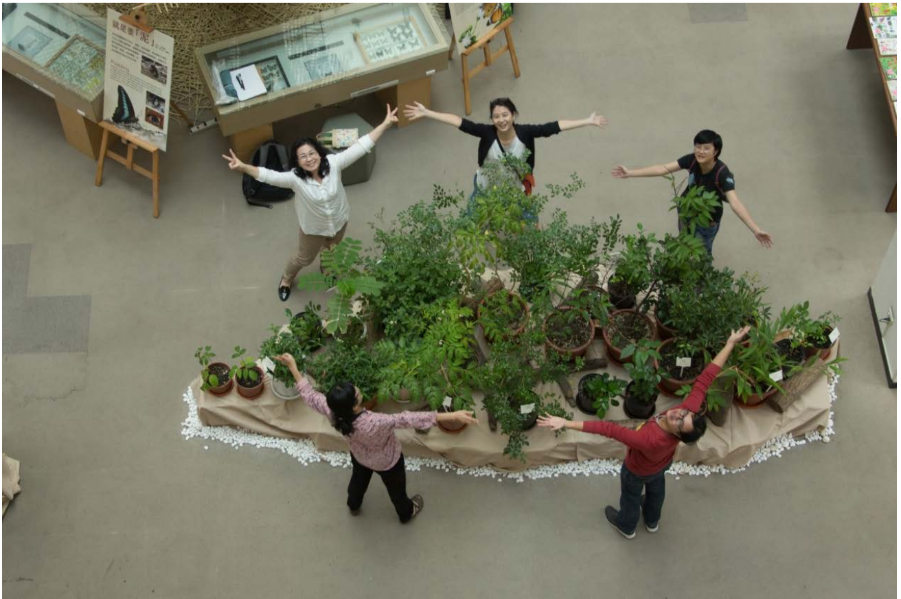
圖4 蜜源植物展示區由上方俯瞰排成一個台灣島的形狀