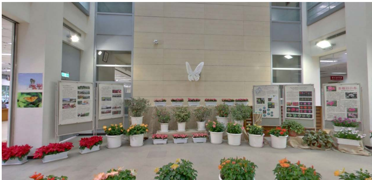
圖2 花卉新品種展示