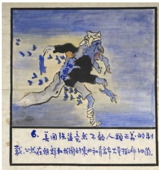
圖一：唐代的胡人塑像