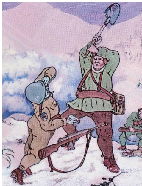
圖四：盟友有高挺的鼻子